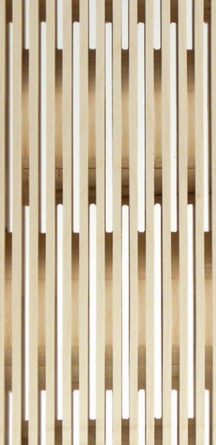
front & back side: 4/4 mm, 3-layer spruce