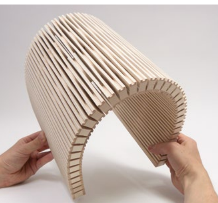
4/4 mm, 3-layer spruce